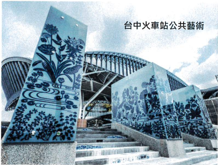
台中火車站公共藝術