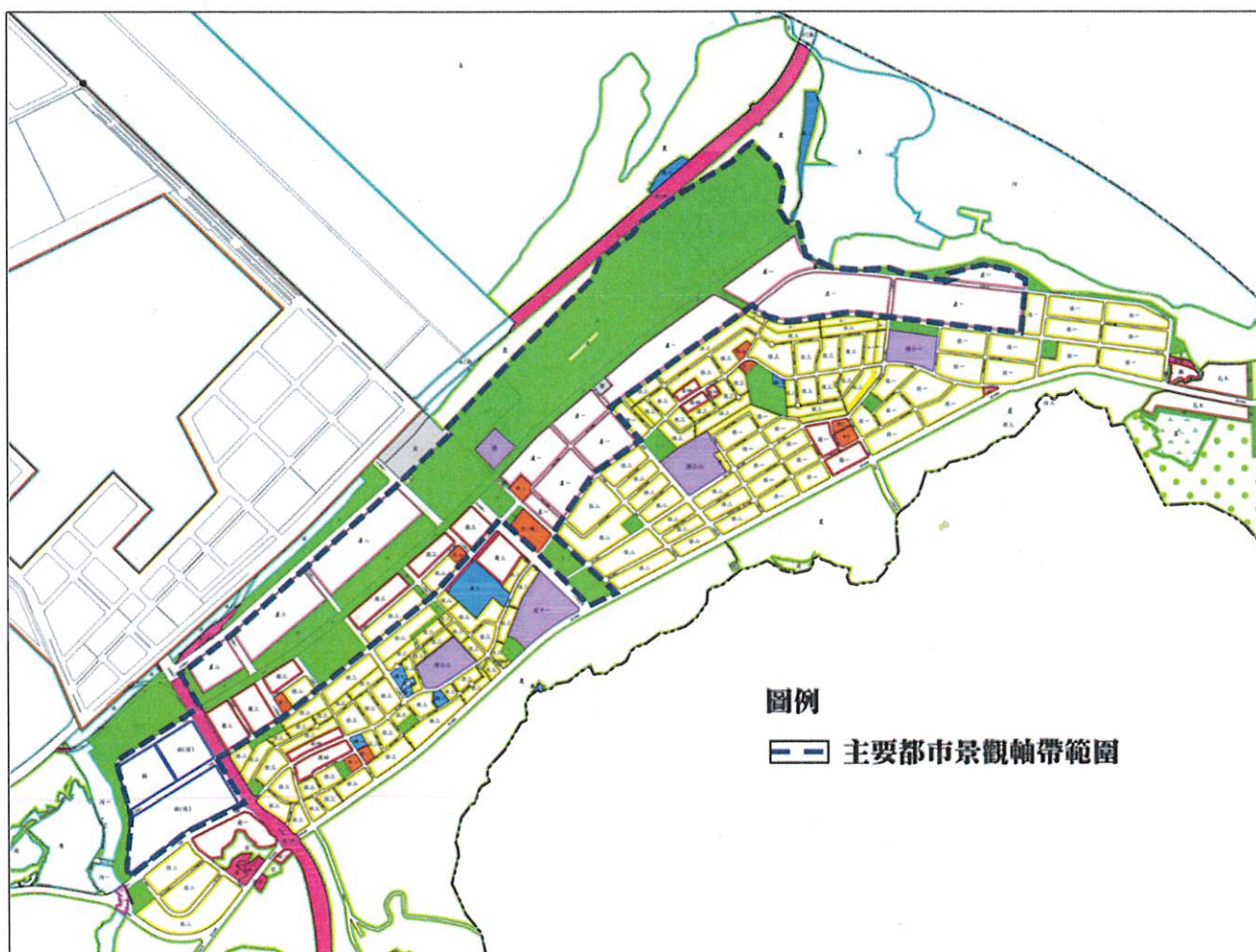
附圖一：臺北港特定區重要軸線範圍圖

八、本審議原則若執行上有疑義時，得經本市都市設計審議及土地使用開發許可審議會作成共通性決議後據以執行。