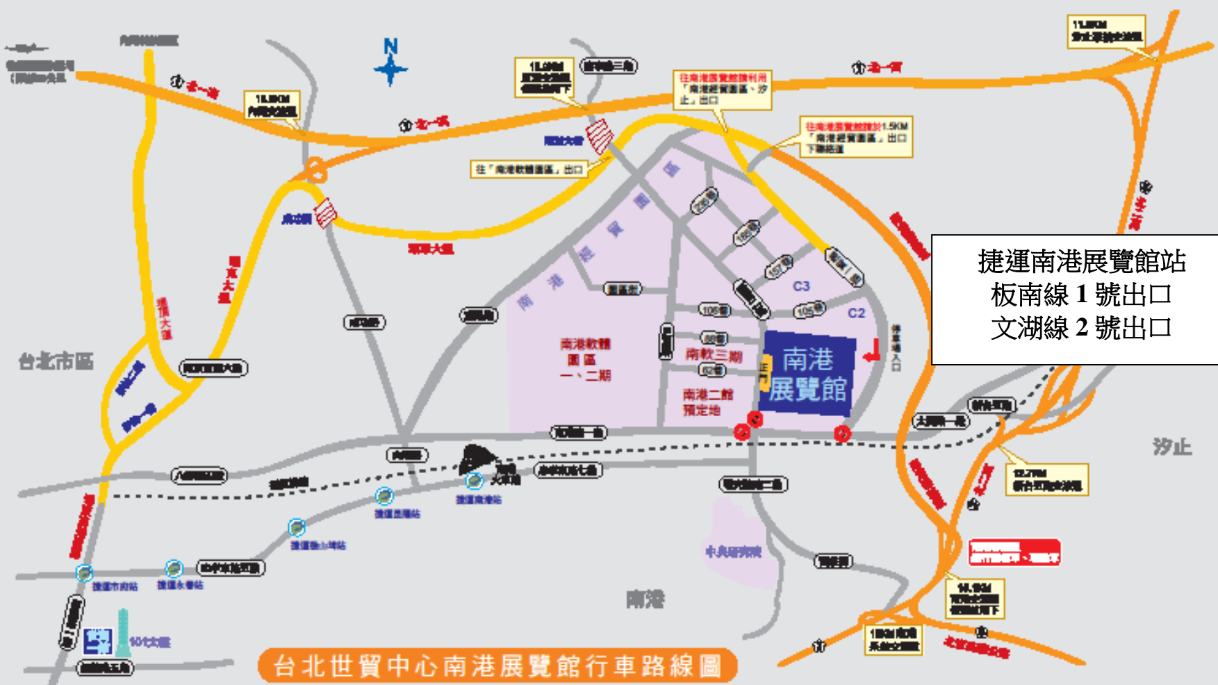
台北世貿中心南港展覽館行車路線圖

往南港展覽館行車路線說明：(南港展覽館衛星導航座標：X(經度):121° 34' 58.9"、Y(緯度)：25° 47.6")