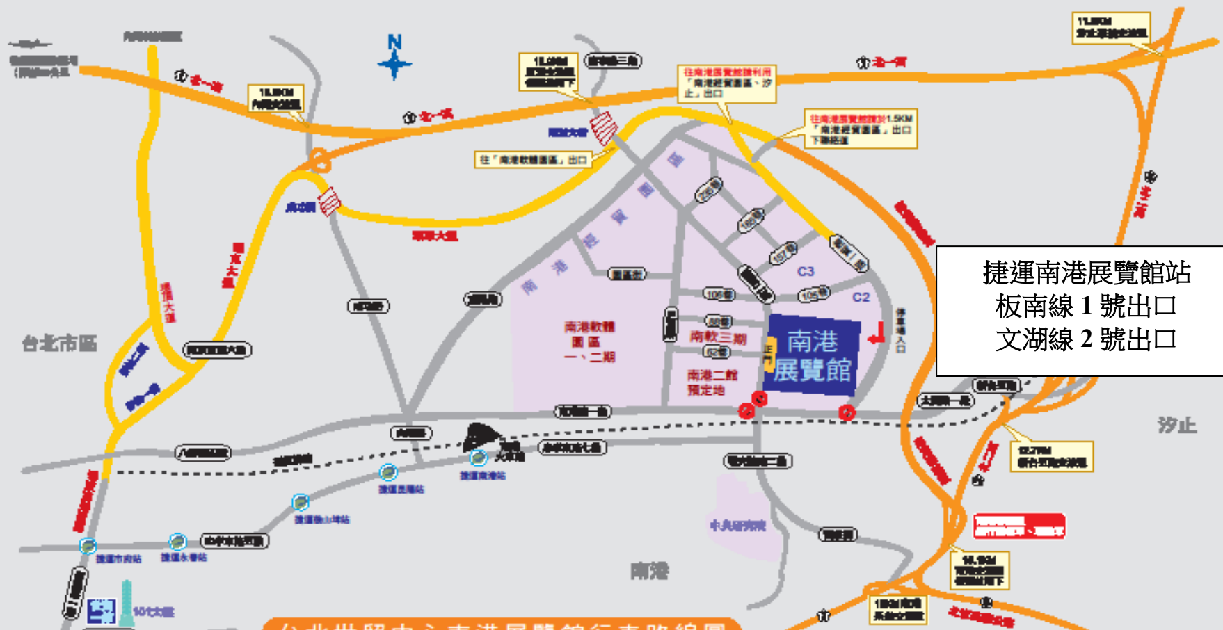
台北世貿中心南港展覽館行車路線圖

往南港展覽館行車路線說明：(南港展覽館衛星導航座標：X(經度):121° 34' 58.9"、Y(緯度)：25° 47.6")