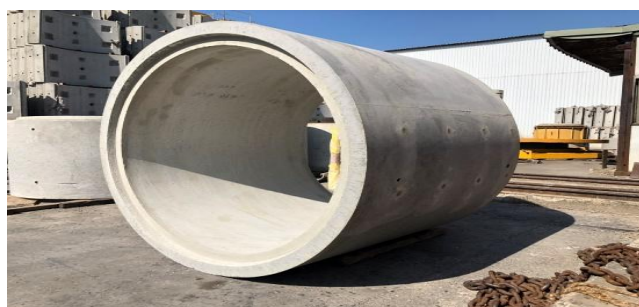
圖 6.3 推進用鋼筋混凝土管