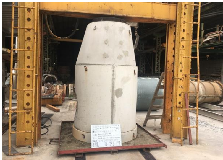
圖 6.4 預鑄 RC 人孔