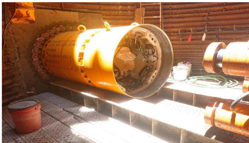
圖 6.1 密閉式推進機械