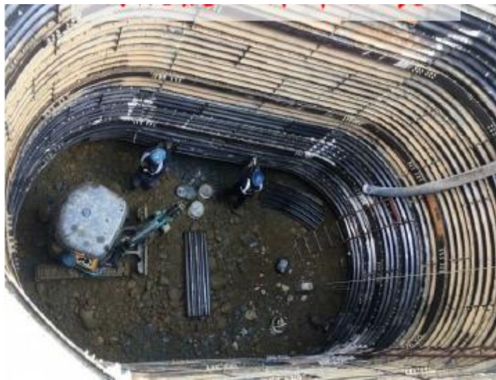
圖 6.5 鋼襯板工作井

(2) 鋼襯板工作井多設於卵礫石層，組成構件具模組化生產特性，假設工程完成後，需將上部鋼襯板抽除，可回收使用、降低單位成本。