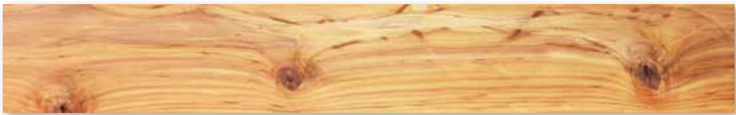
CNS 14630 「針葉樹結構用製材」甲種 II 類結構用製材之 3 等材外觀