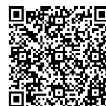
2020 年版綠建材 解說與評估手冊