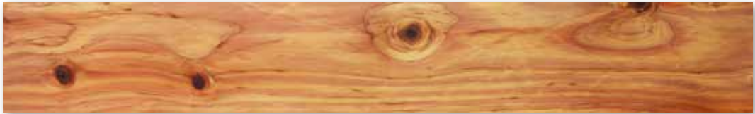
CNS 14630 「針葉樹結構用製材」甲種 II 類結構用製材之 1 等材外觀