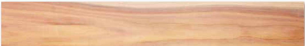
CNS 14630 「針葉樹結構用製材」甲種 II 類結構用製材之 2 等材外觀