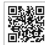
示意圖 以實際為準