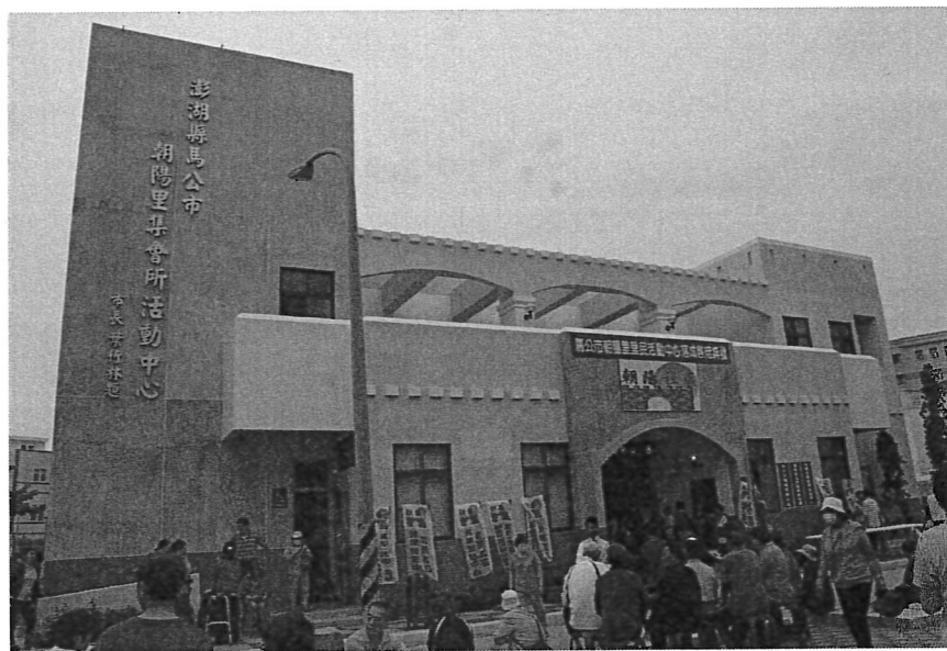
馬公市朝陽里集會所活動中心